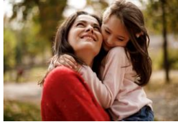
Les mamans et l'été